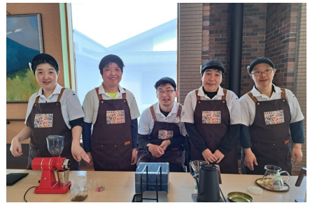
長野県 ⑤ 軽井沢ひまわり