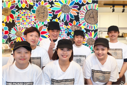
茨城県 ④ Colorful Coffee