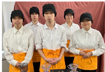
東京都 ② AMS Challenge Café