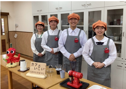
広島県 ⑨ 広島県立三原特別支援学校