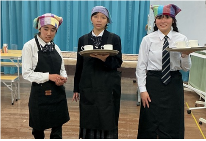
広島県 ⑦ チーム大崎分教室