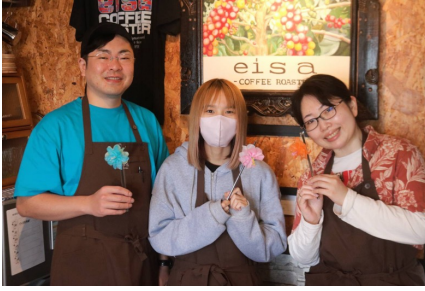
青森県 ① eisa -COFFEE ROASTER-