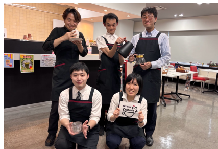
東京都 ⑥ SKY CAFE Kilatto