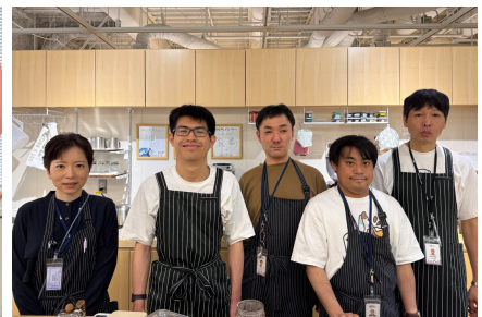
東京都 ③ Café de Bell