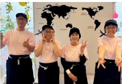
宮崎県・鹿児島県合同チーム ⑩ MIRAKURU